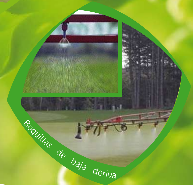
Boquillas de baja deriva